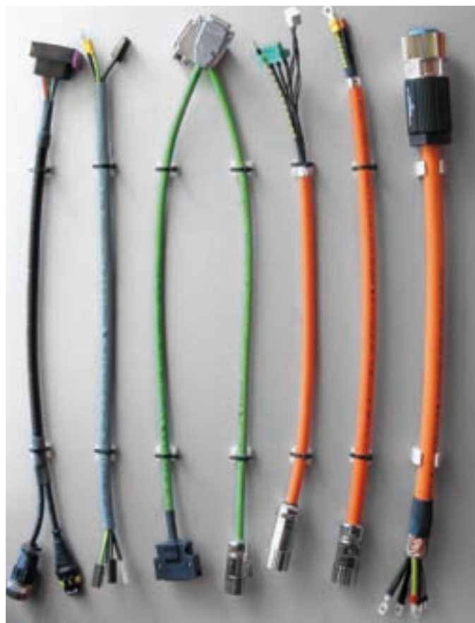
Automation and Robotic Automazione e Robotica